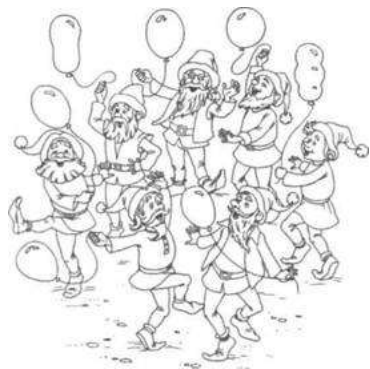
Рис. 5. К игре «Гномики»

Речевой материал: названия цветов, гномики, шарик, раскрась, положи такой же, по цвету, какого цвета.