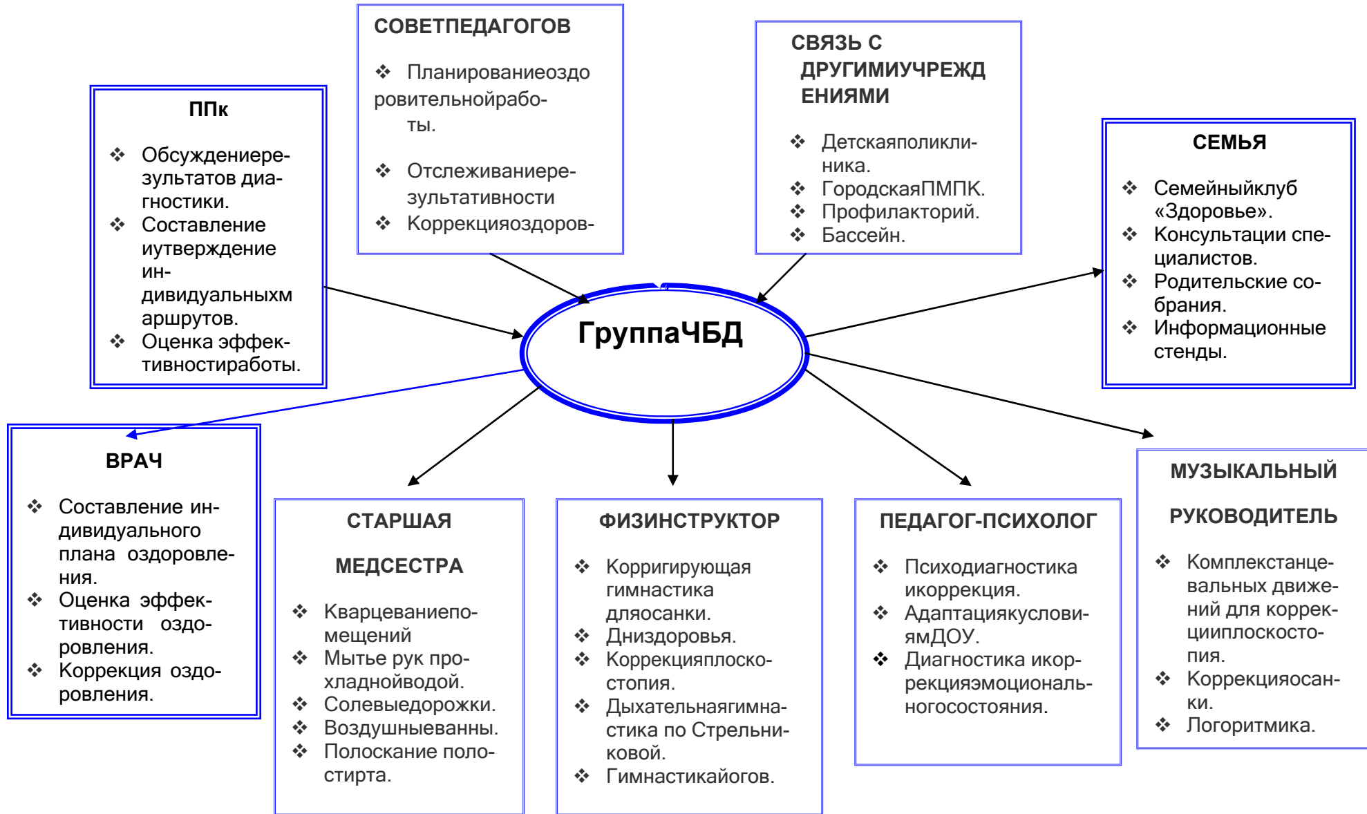
Рисунок 1. Схема организации деятельности с частоболеющими детьми в МБДОУ №26