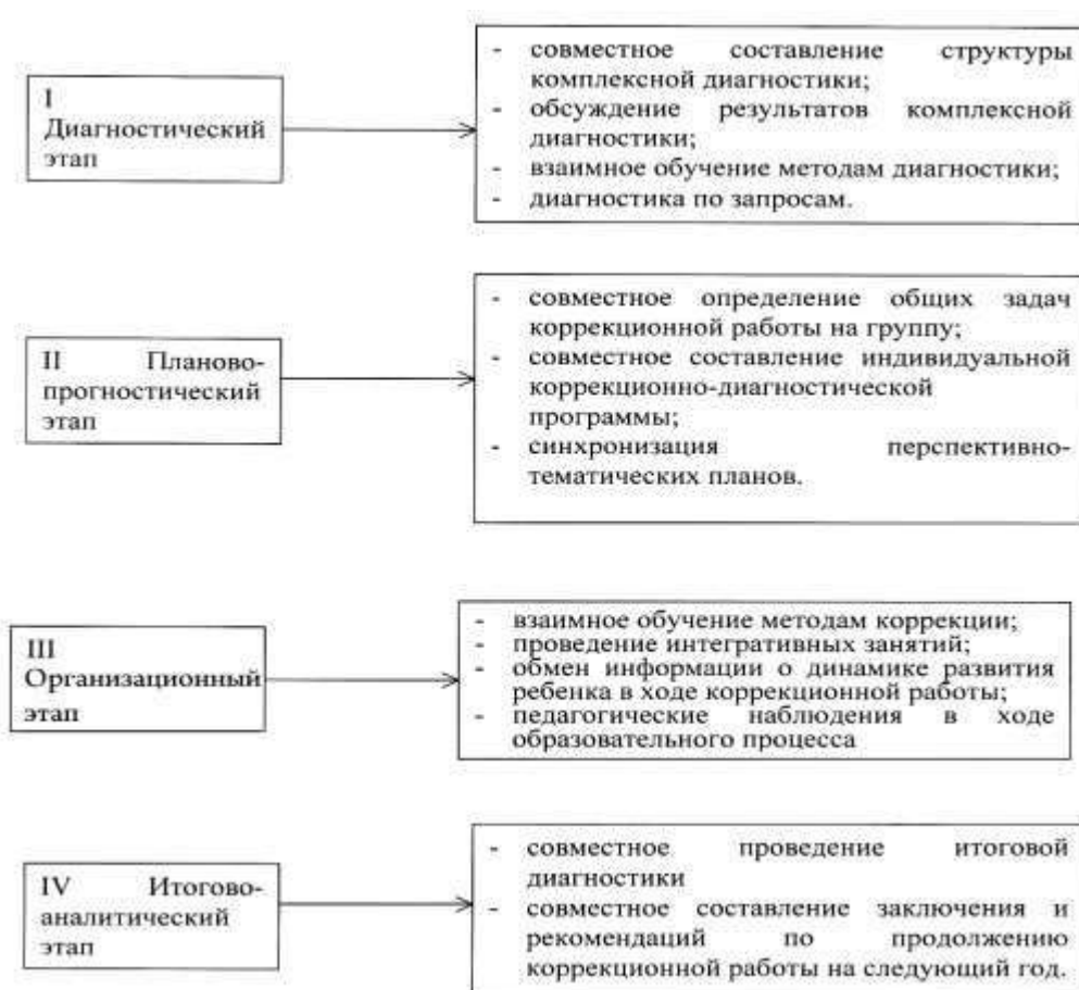
Рисунок 3. Система взаимодействия специалистов в процессе диагностики.

В ДОУ осуществляется вводная (сентябрь), текущая или промежуточная (январь), итоговая (май) диагностика. Результаты заносятся в разработанные карты. По итогам промежуточной диагностики, прослеживается результативность коррекционного сопровождения, и вносятся коррективы в дальнейшее планирование работы с ребенком в зависимости от динамических наблюдений в течение всего учебного года, в результате чего при необходимости составляется Индивидуальный коррекционный маршрут №2 .