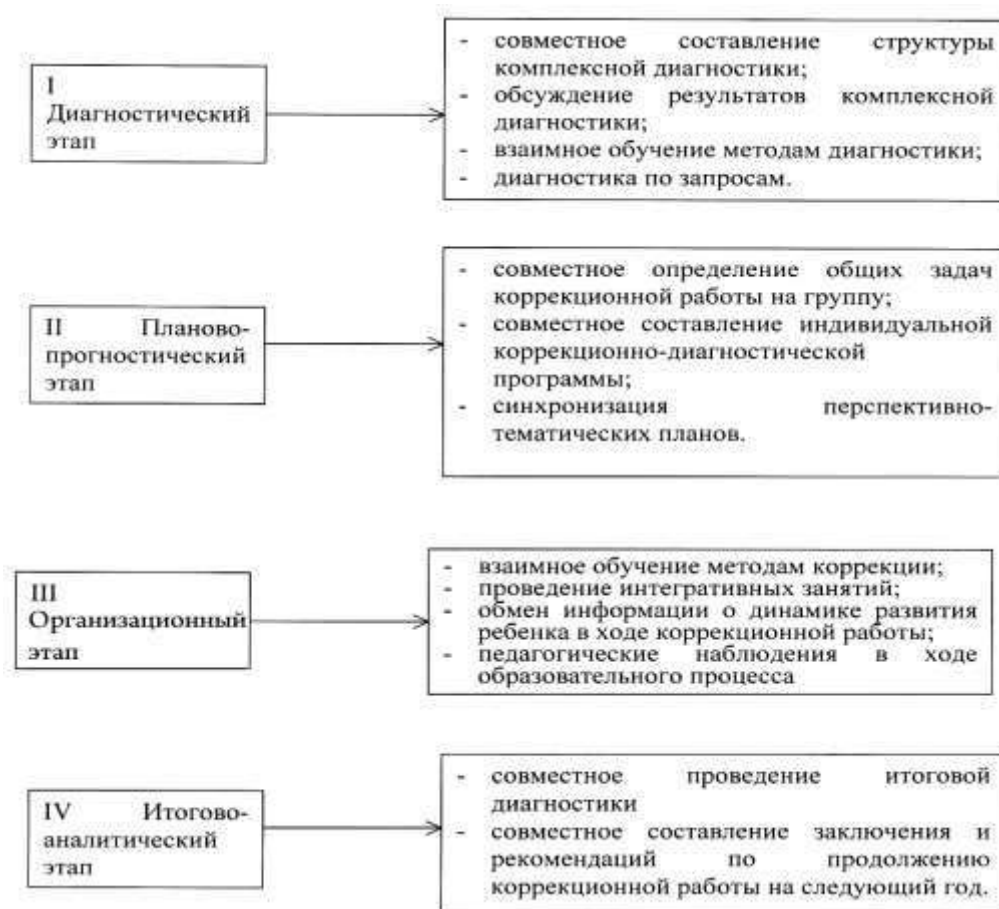
Рисунок 3. Система взаимодействия специалистов в процессе диагностики.

• Осмысление и оценка результатов деятельности по сопровождению. Предполагает анализа развития ребенка, корректировку и проведение дальнейшего коррекционного маршрута.