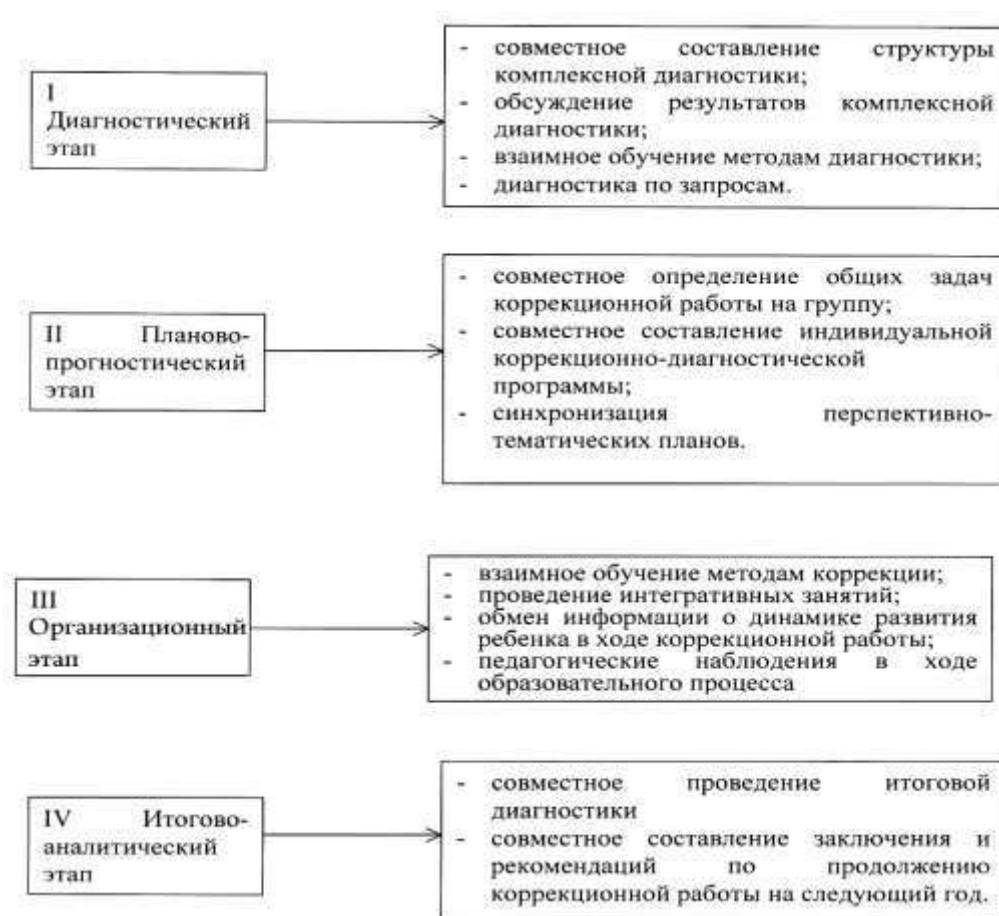
Рисунок 3. Система взаимодействия специалистов в процессе диагностики.

Содержание коррекционной работы направлено на обеспечение коррекции недостатков в физическом и психическом развитии детей с ограниченными возможностями здоровья и оказание помощи детям этой категории в освоении Программы ДОУ.